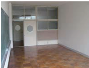
クリエイター育成室