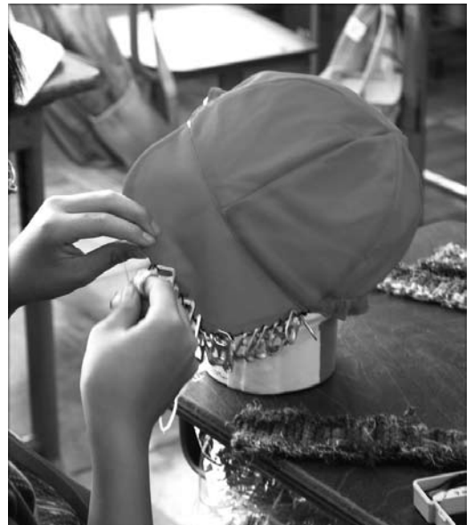
2010「こわすことは、つくること。」見なれた赤帽が大変身!